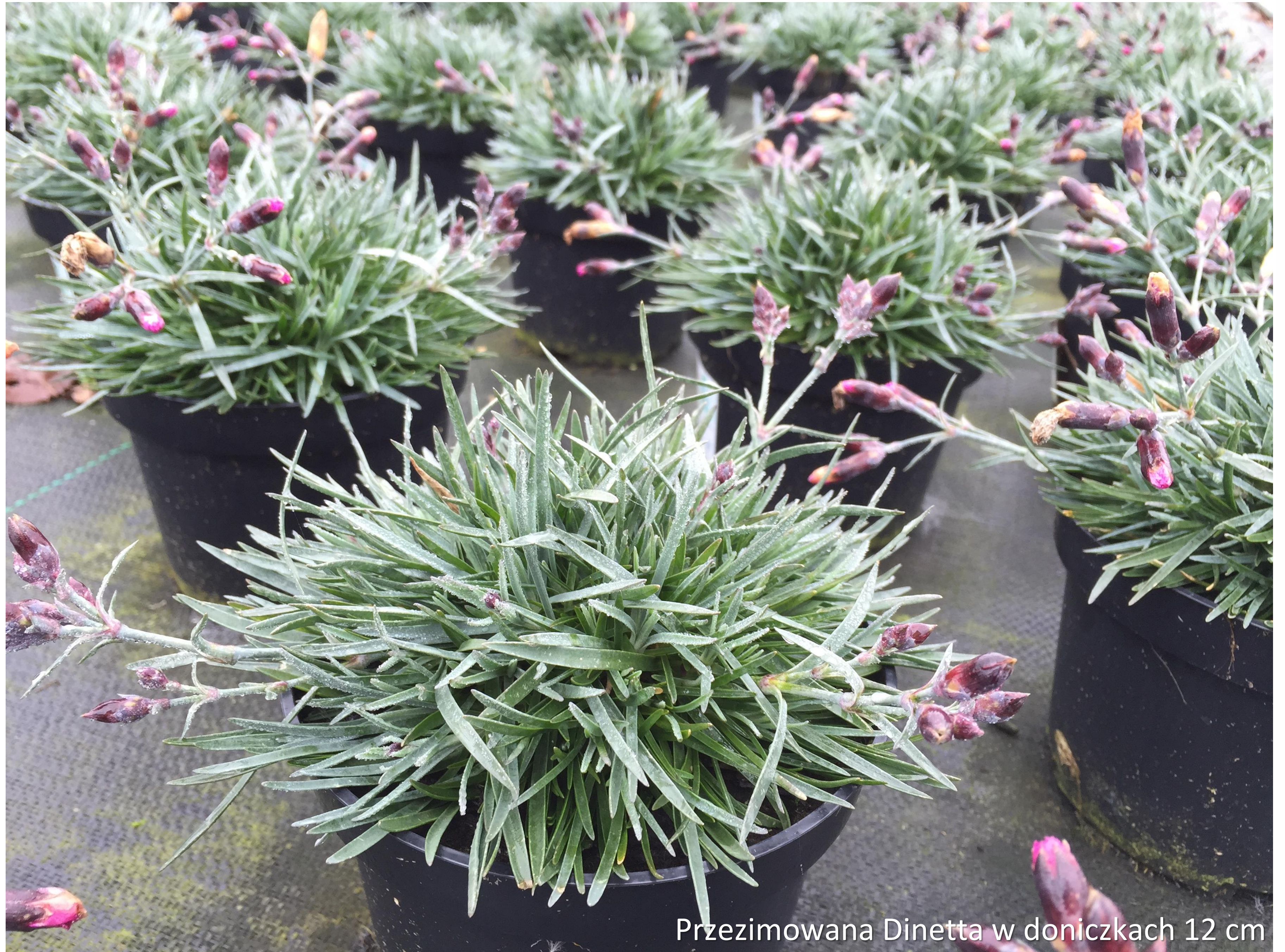
Przezimowana Dinetta w doniczkach 12 cm