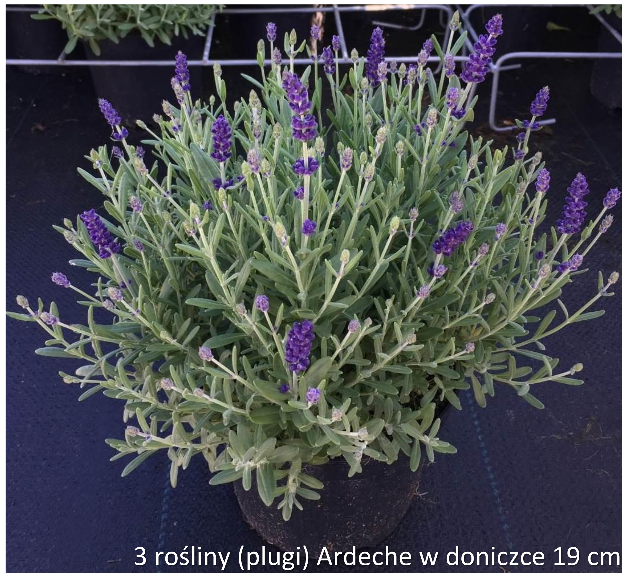
3 rośliny (plugi) Ardeche w doniczce 19 cm