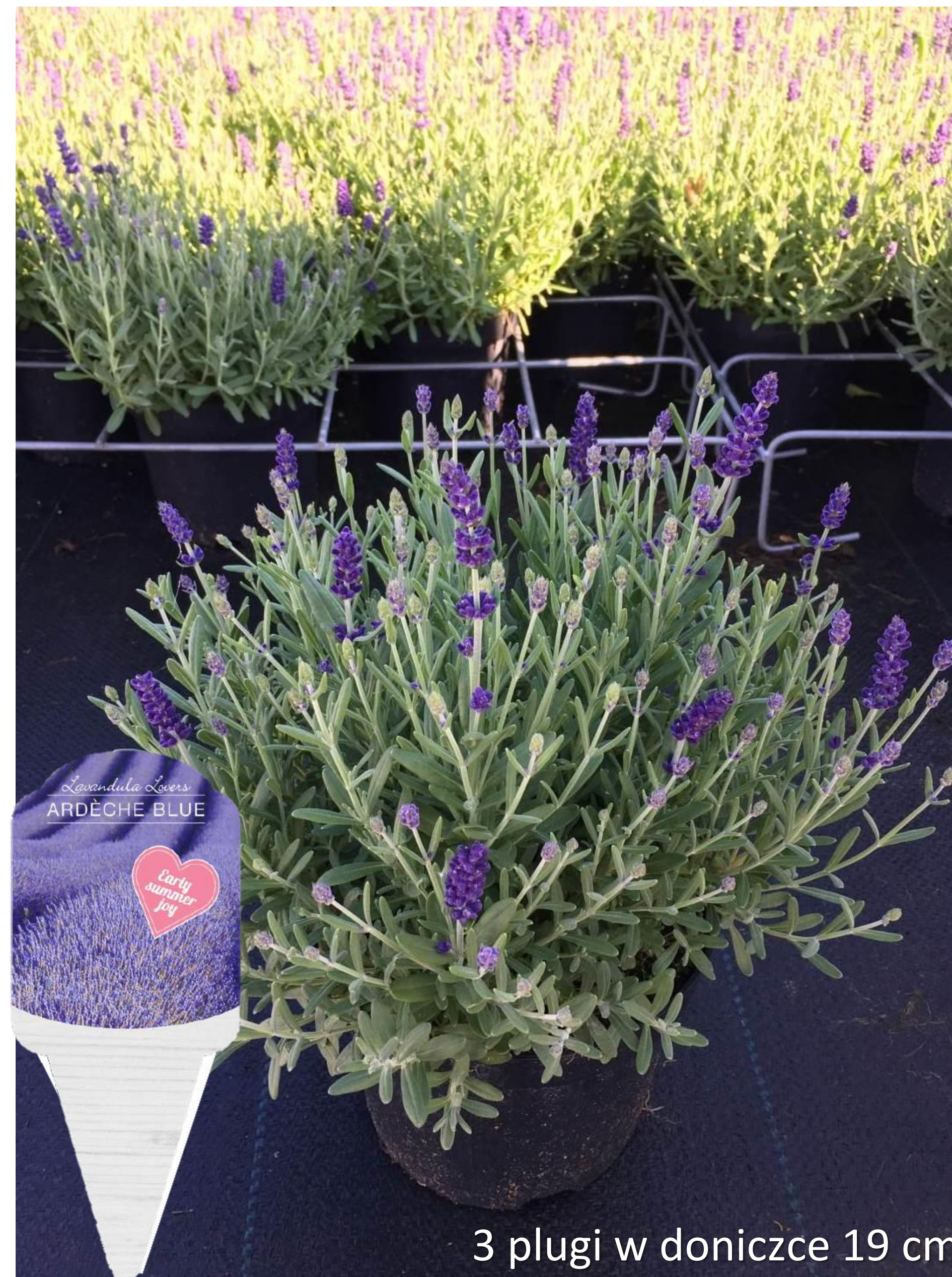
3 plugi w doniczce 19 cm