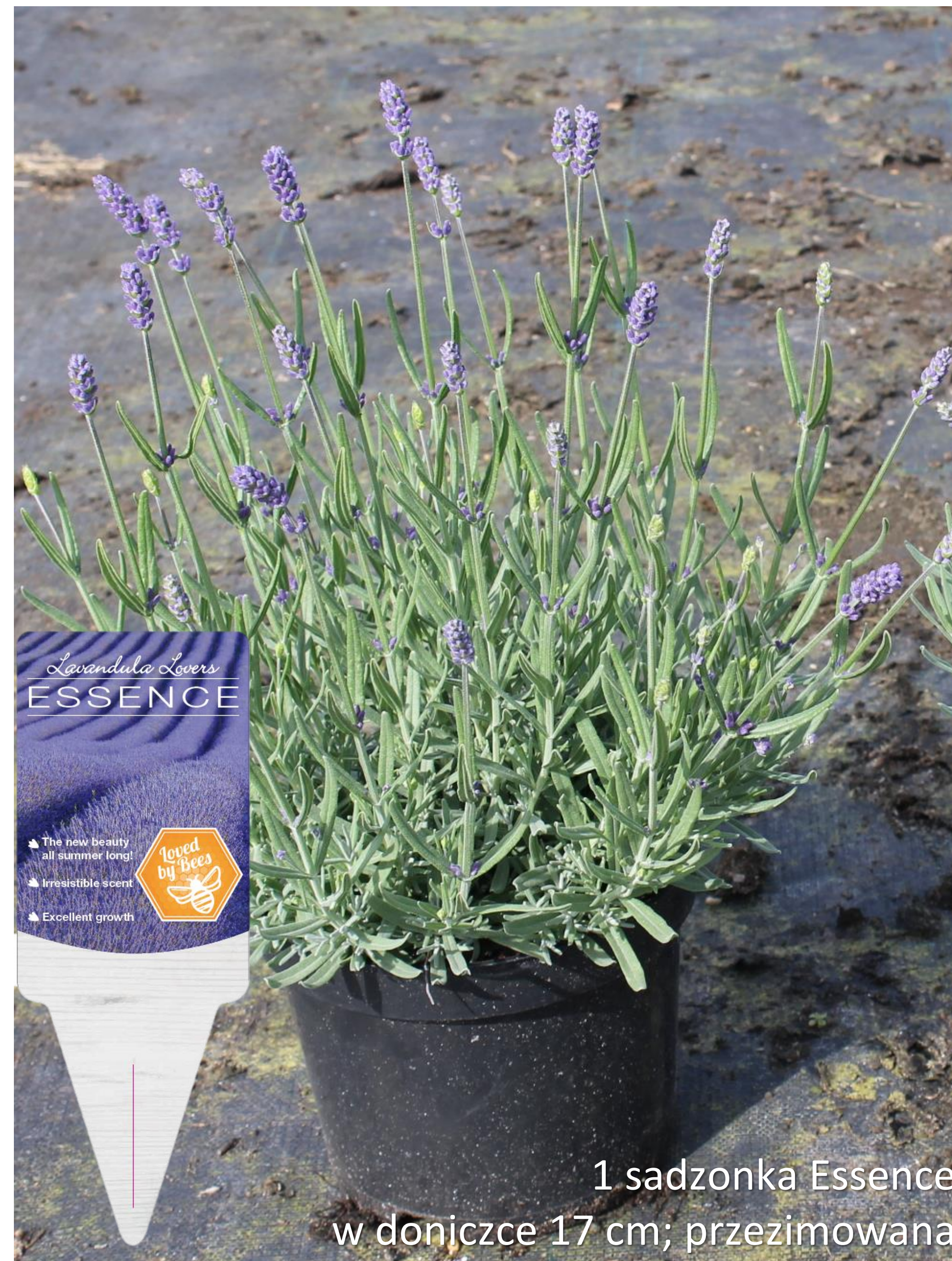
1 sadzonka Essence w doniczce 17 cm; przezimowana