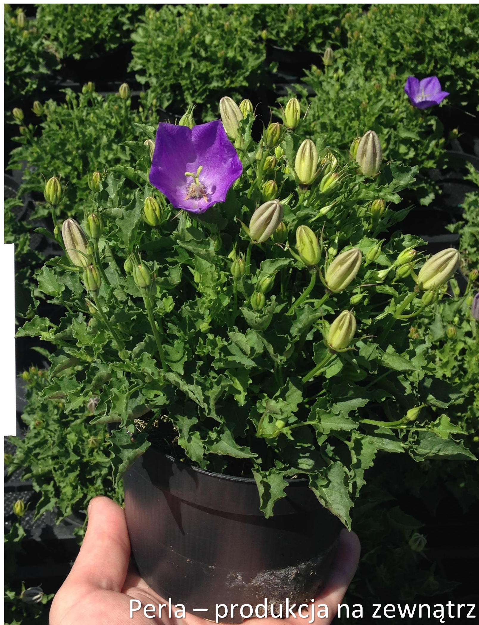
Perla – produkcja na zewnątrz