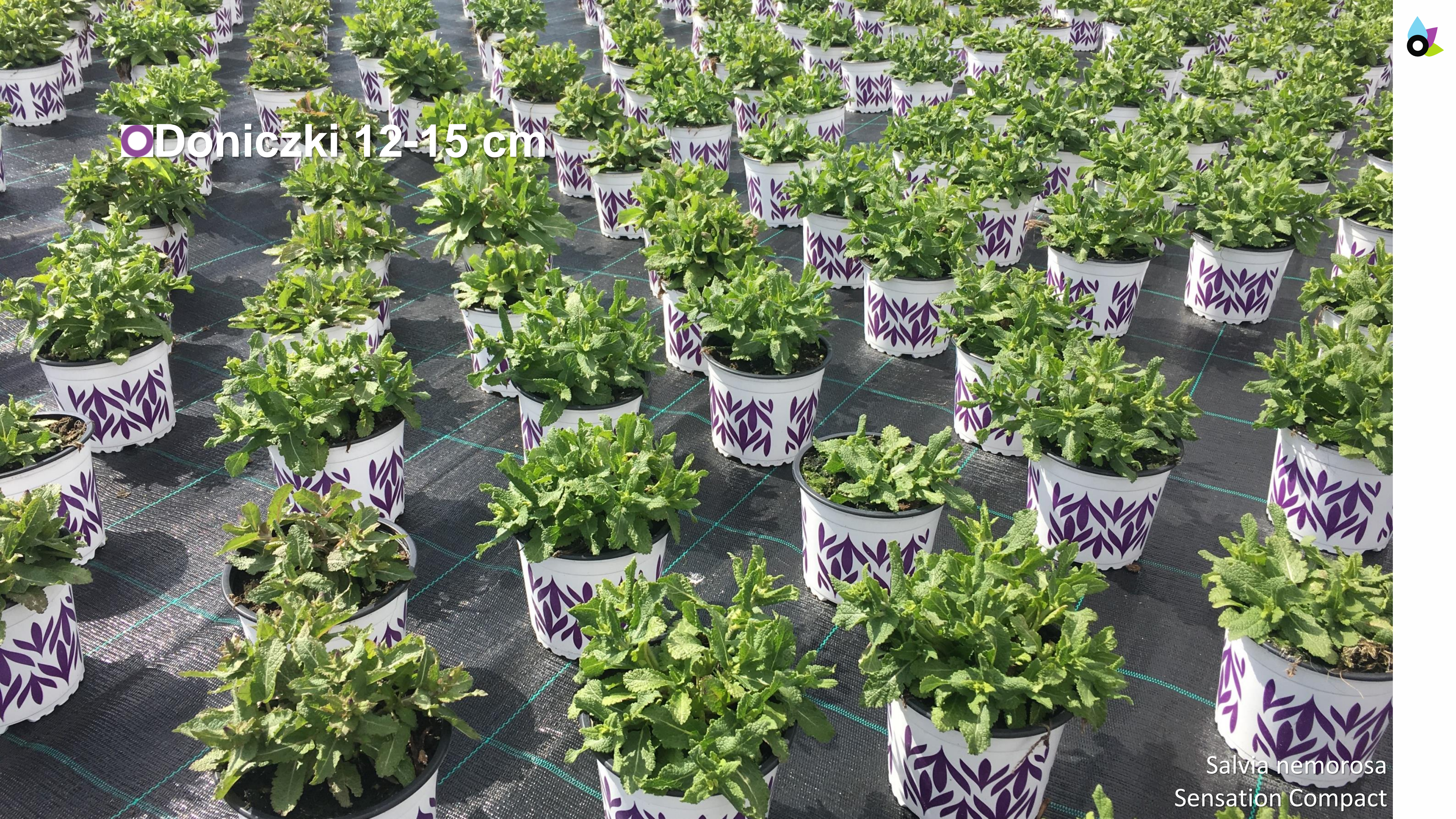
Salvia nemorosa Sensation Compact