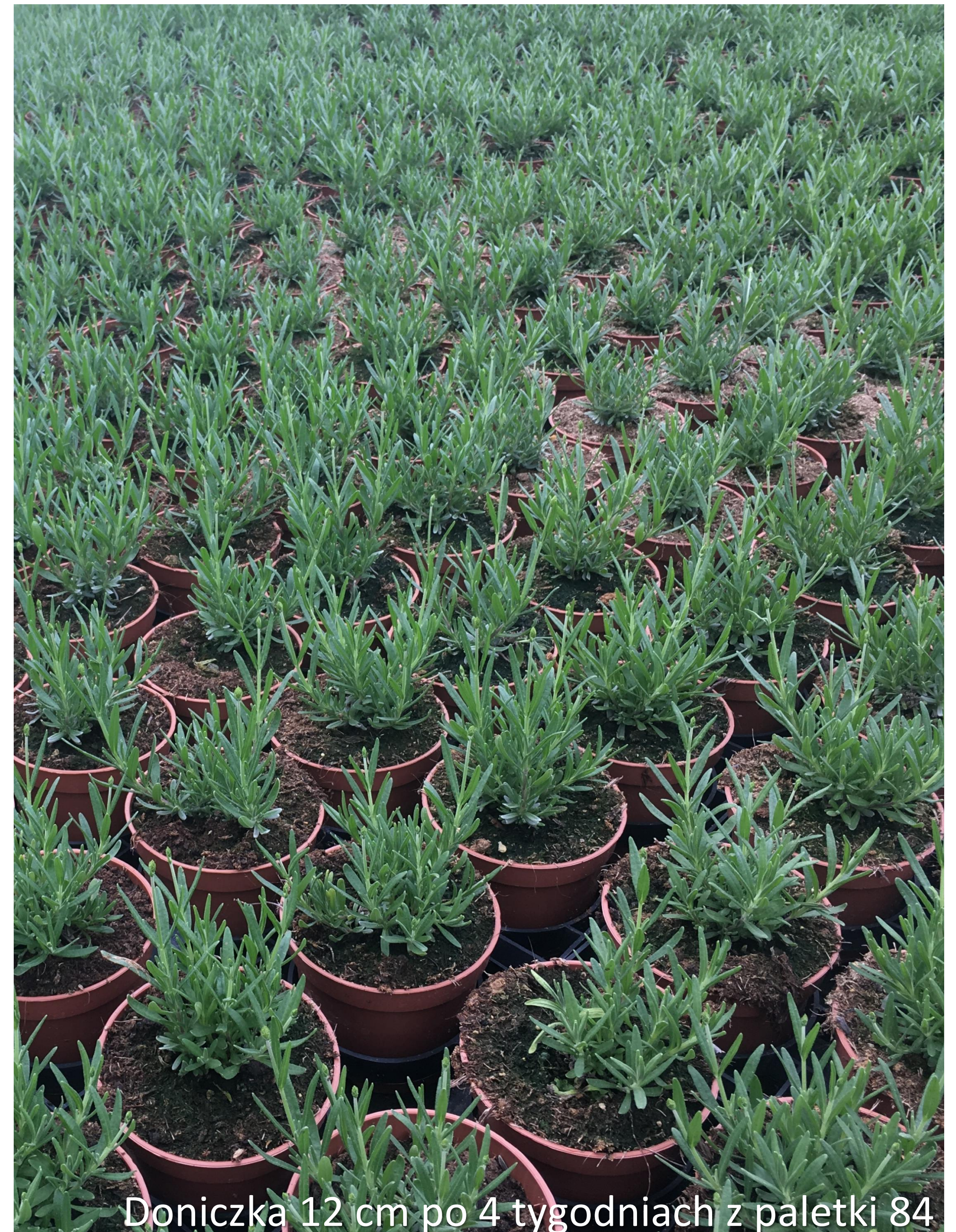
Doniczka 12 cm po 4 tygodniach z paletki 84