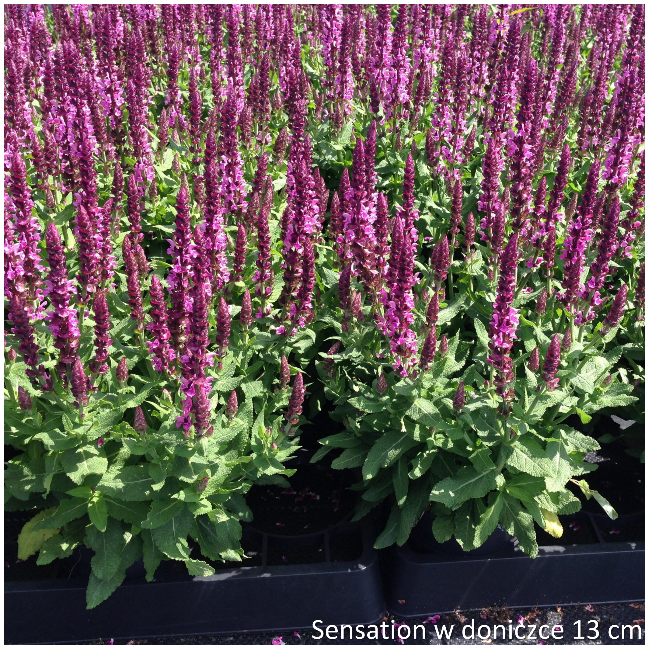
Sensation w doniczce 13 cm po