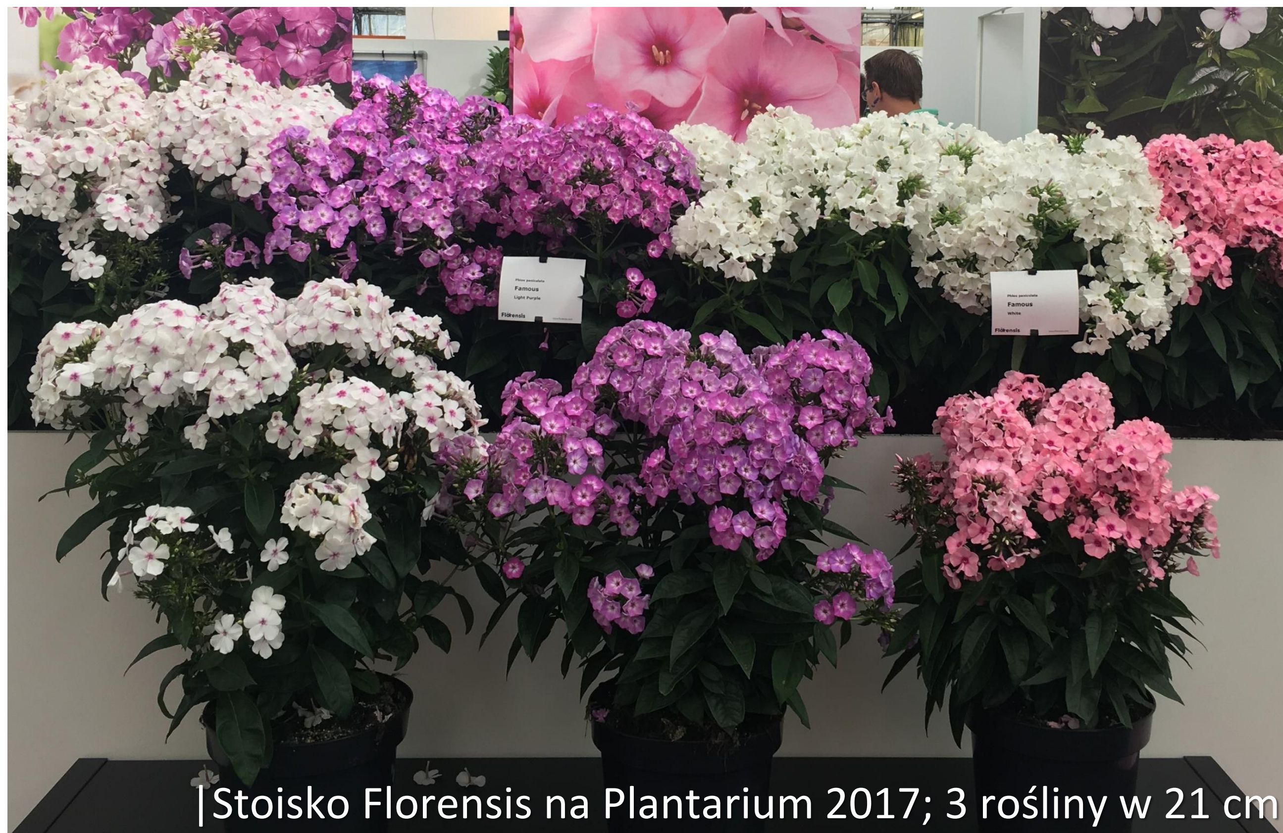
| Stoisko Florensis na Plantarium 2017; 3 rośliny w 21 cm