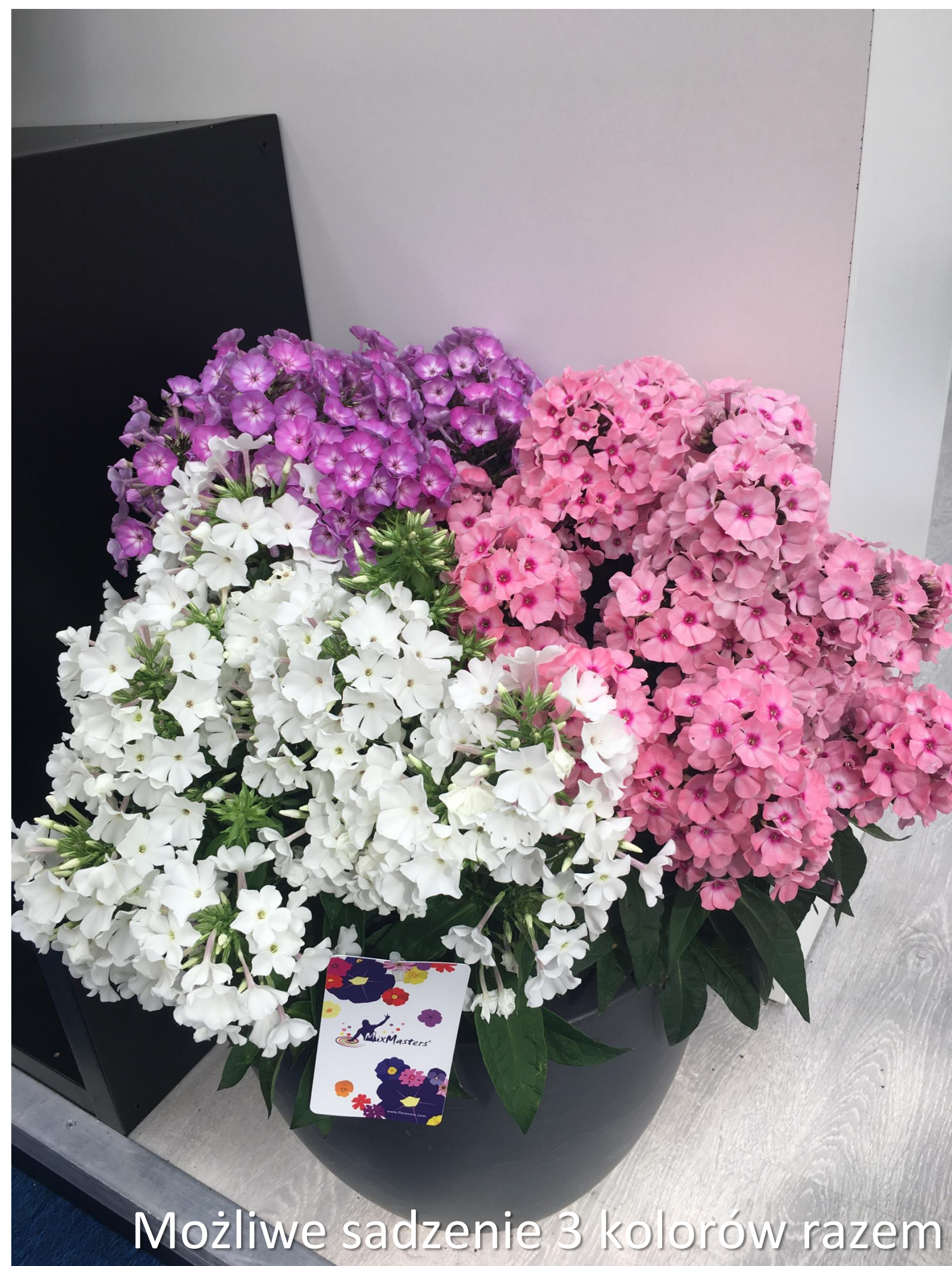
Możliwe sadzenie 3 kolorów razem