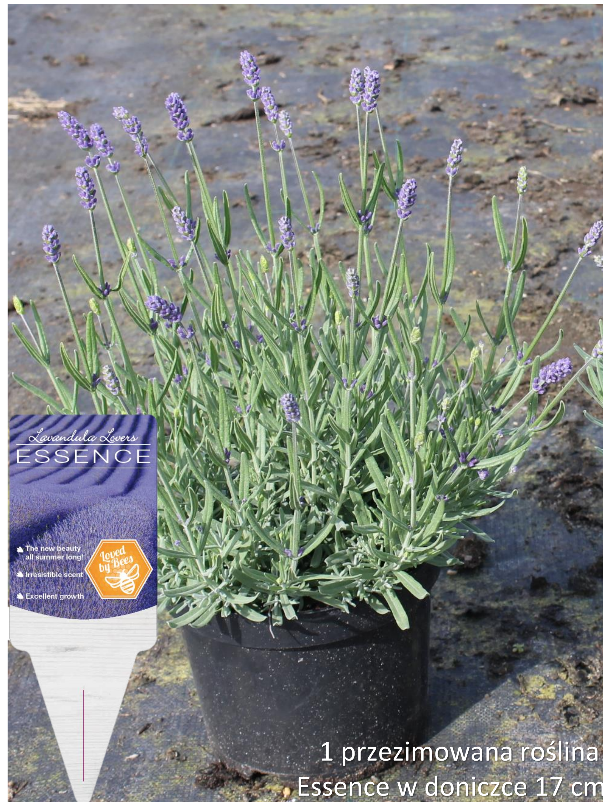
1 przezimowana roślina Essence w doniczce 17 cm