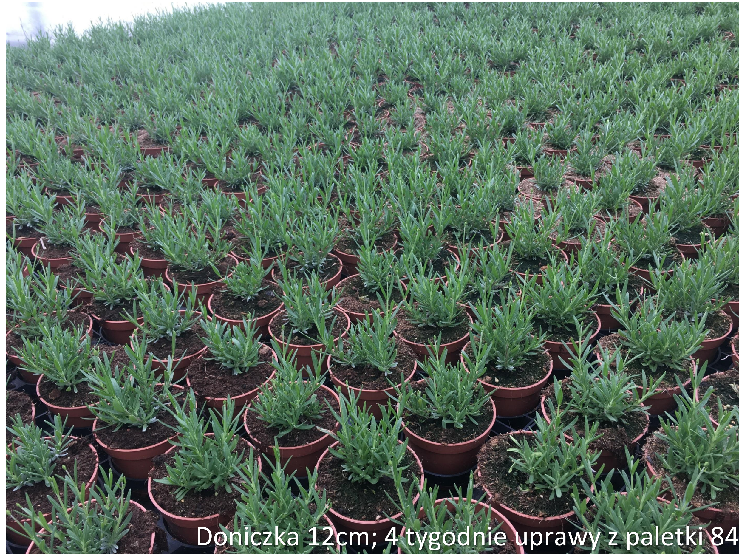
Doniczka 12cm; 4 tygodnie uprawy z paletki 84