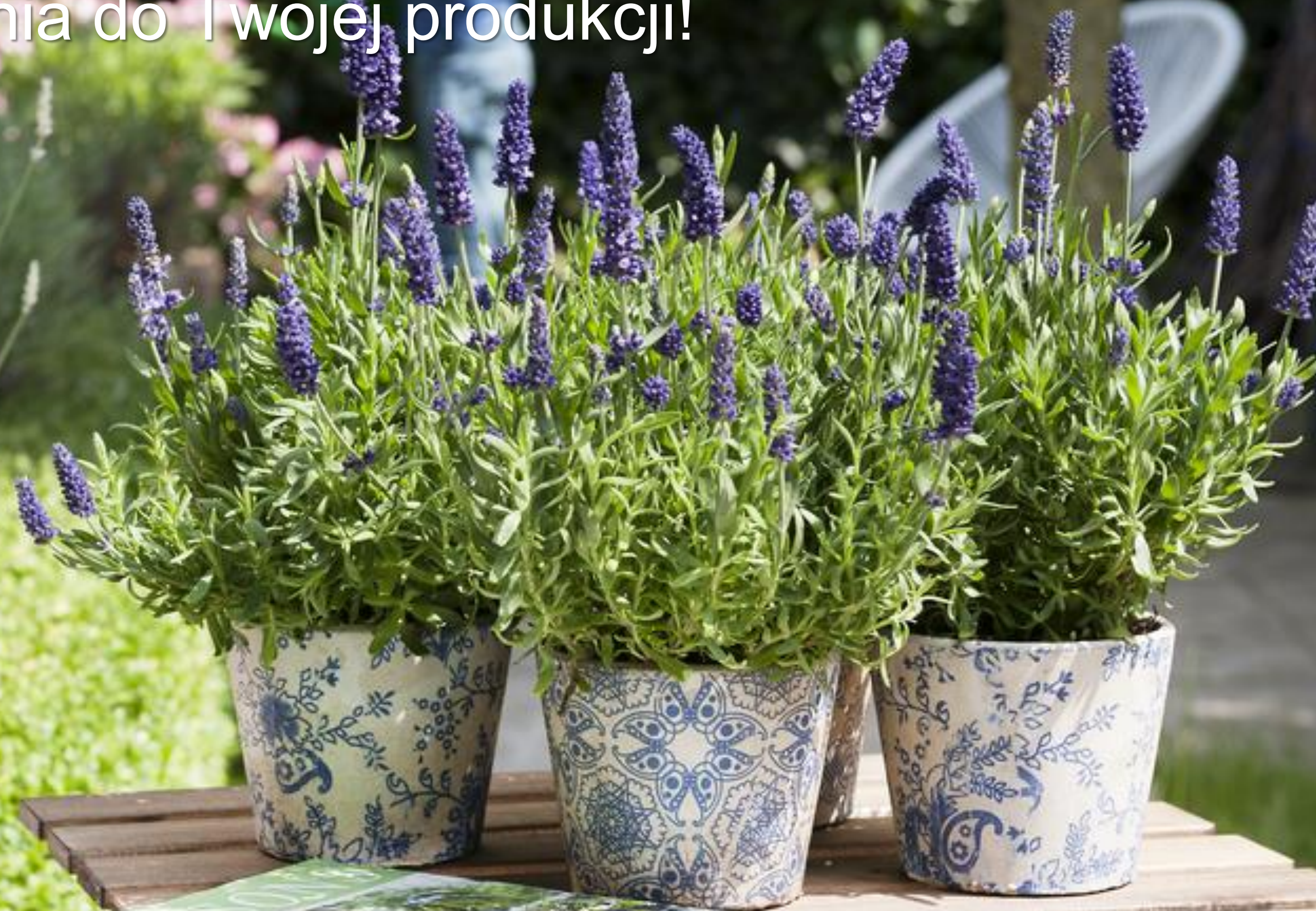
Lavandula angustifolia Spear Blue

Najlepsze rozwiązania do Twojej produkcji!