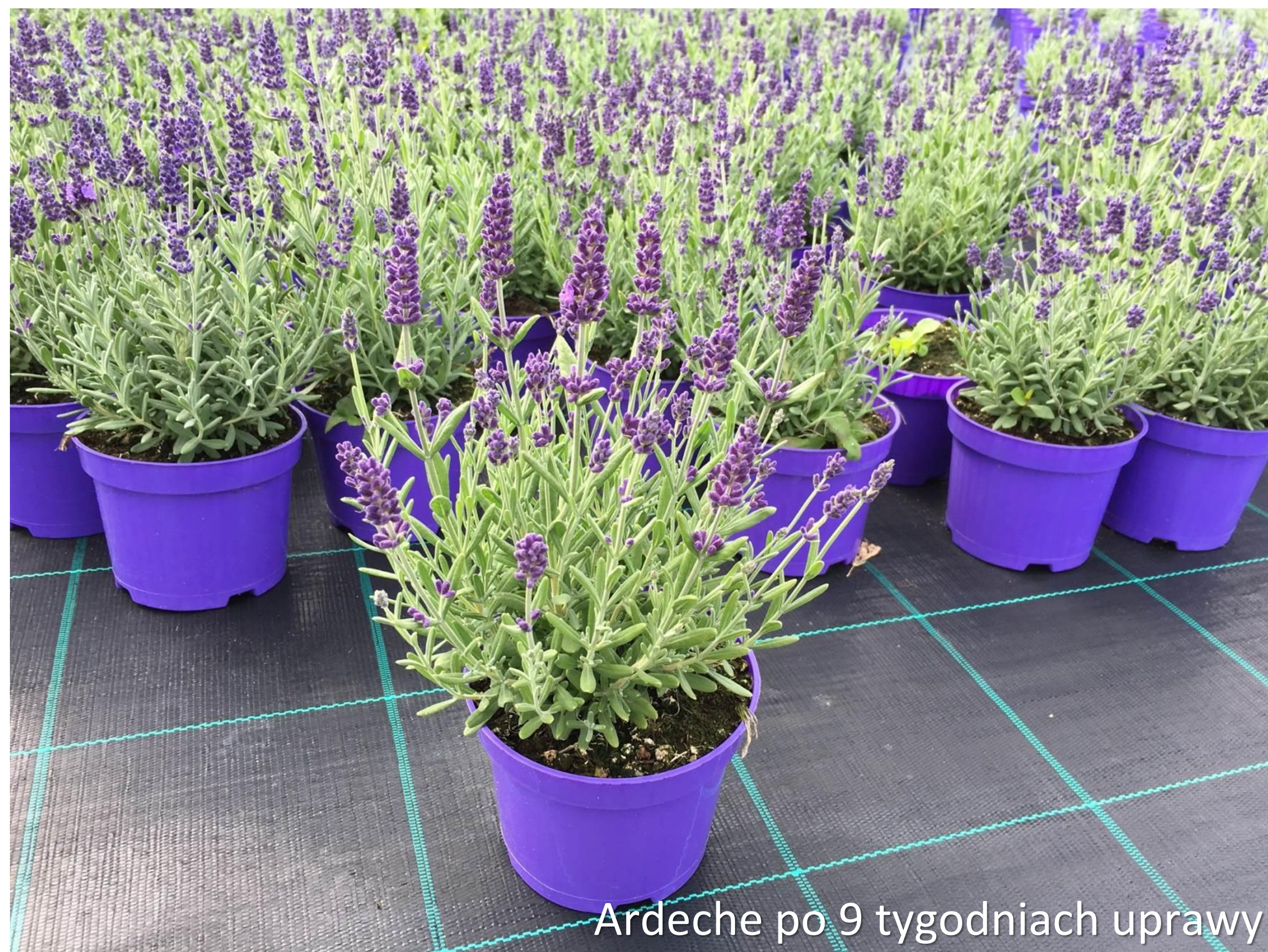
Ardeche po 9 tygodniach uprawy