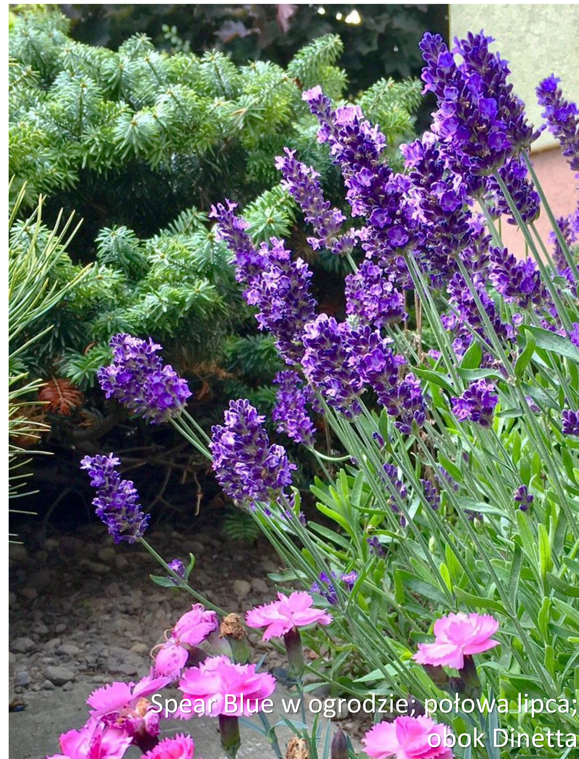
Spear Blue w ogrodzie; połowa lipca; obok Dinetta