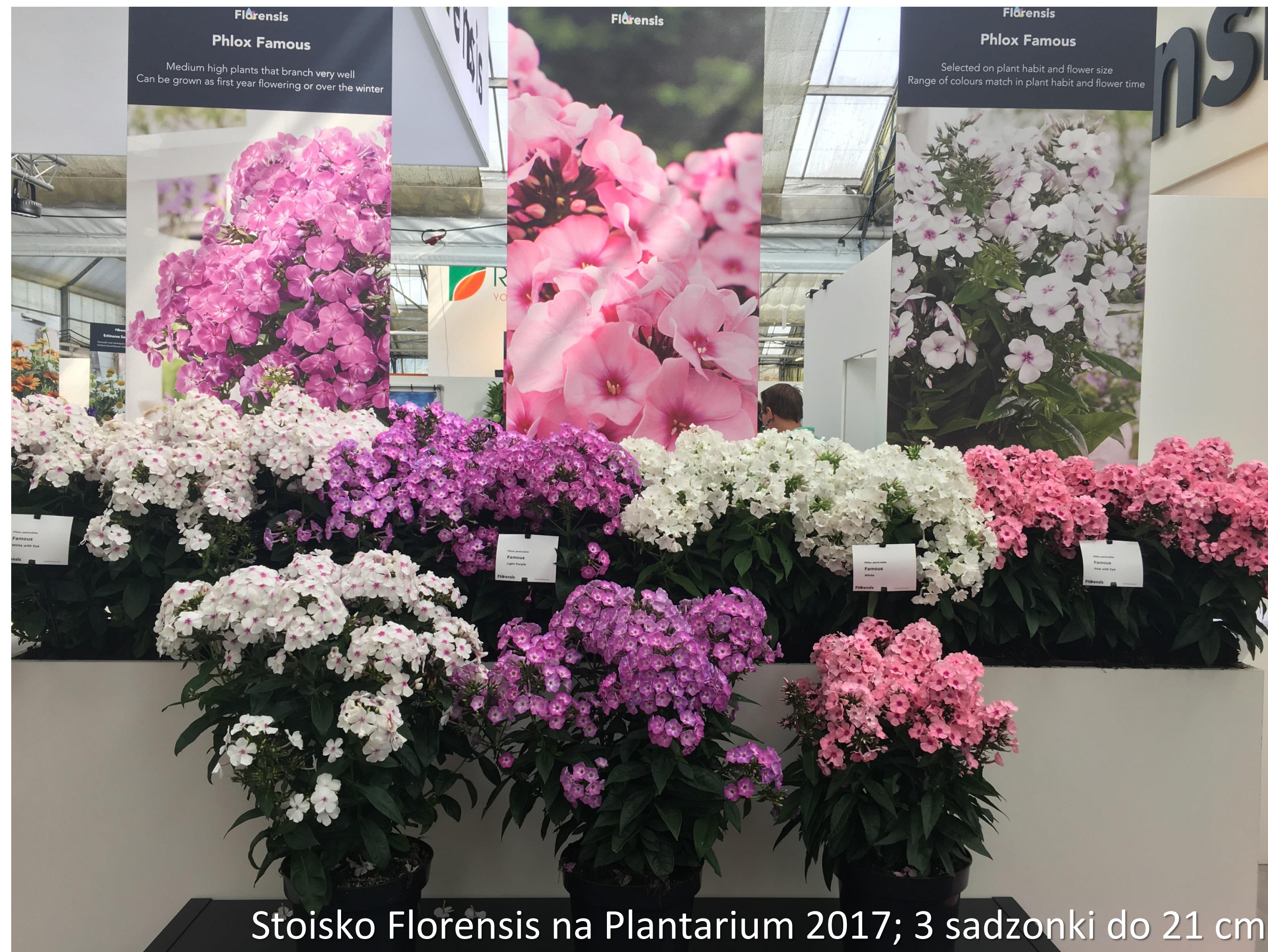
Stoisko Florensis na Plantarium 2017; 3 sadzonki do 21 cm