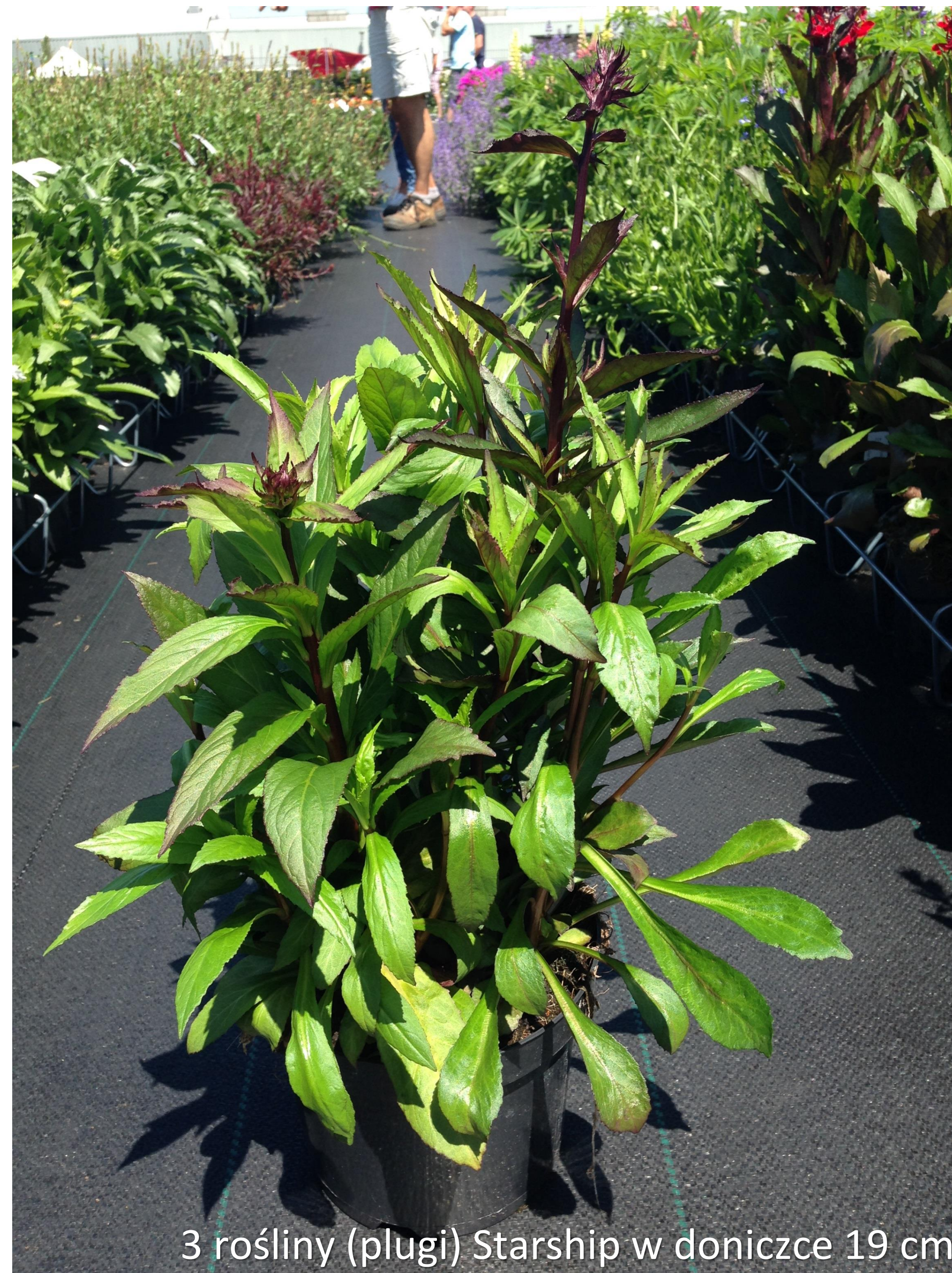
3 rośliny (plugi) Starship w doniczce 19 cm