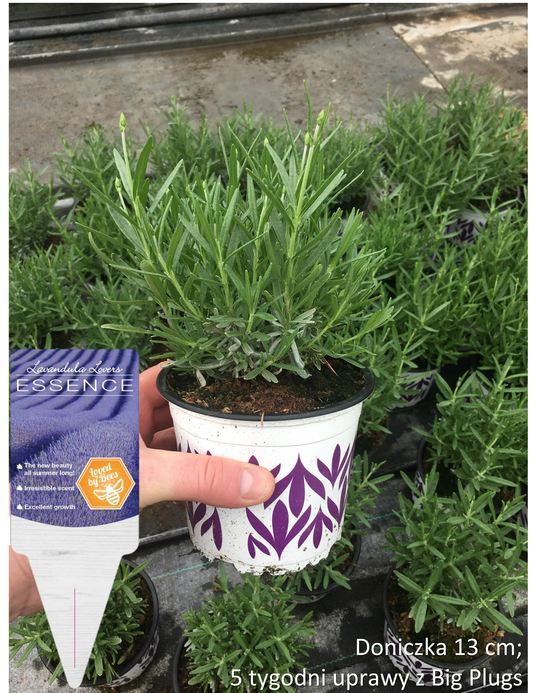
Doniczka 13 cm; 5 tygodni uprawy z Big Plugs