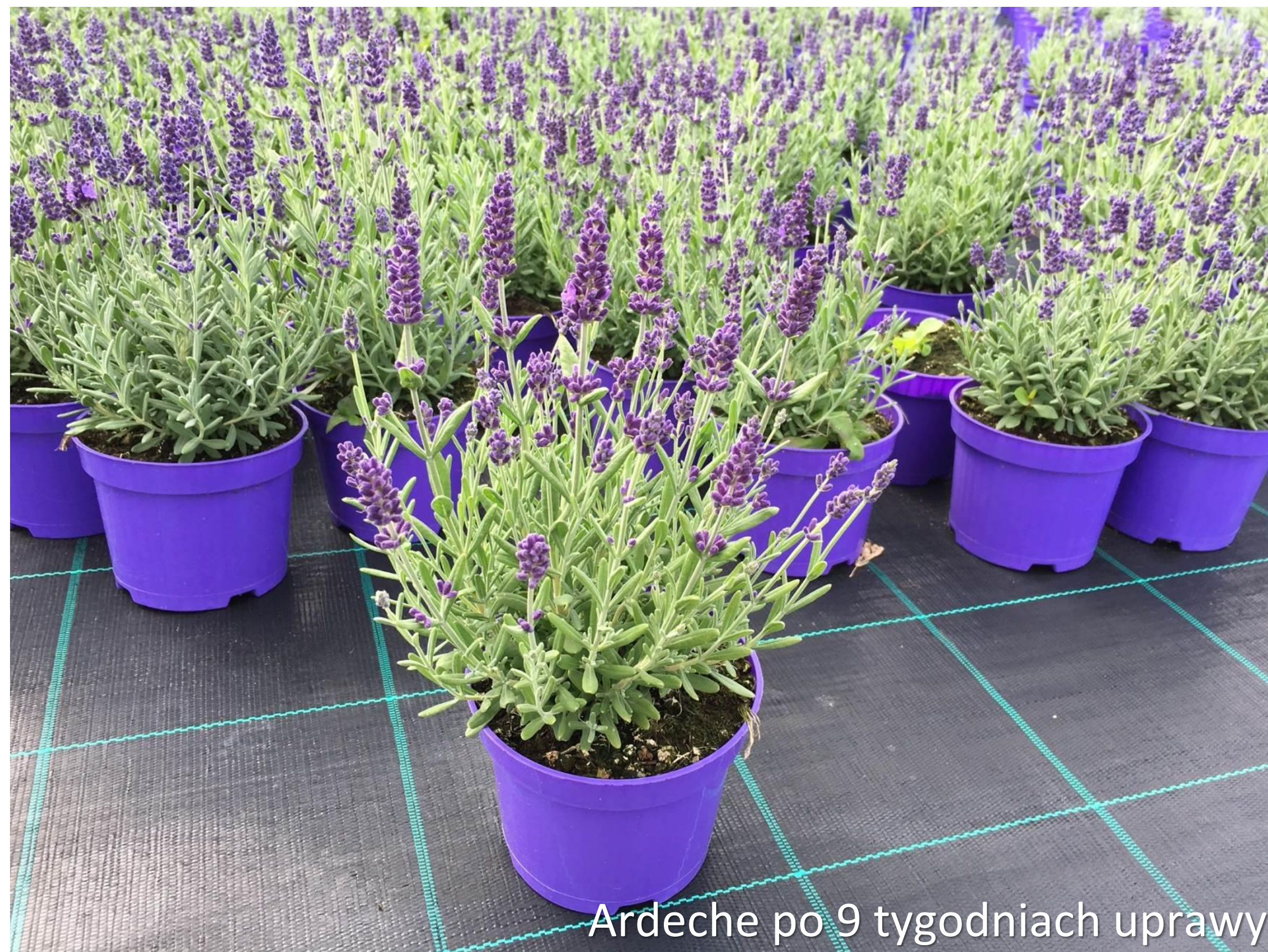
Ardeche po 9 tygodniach uprawy