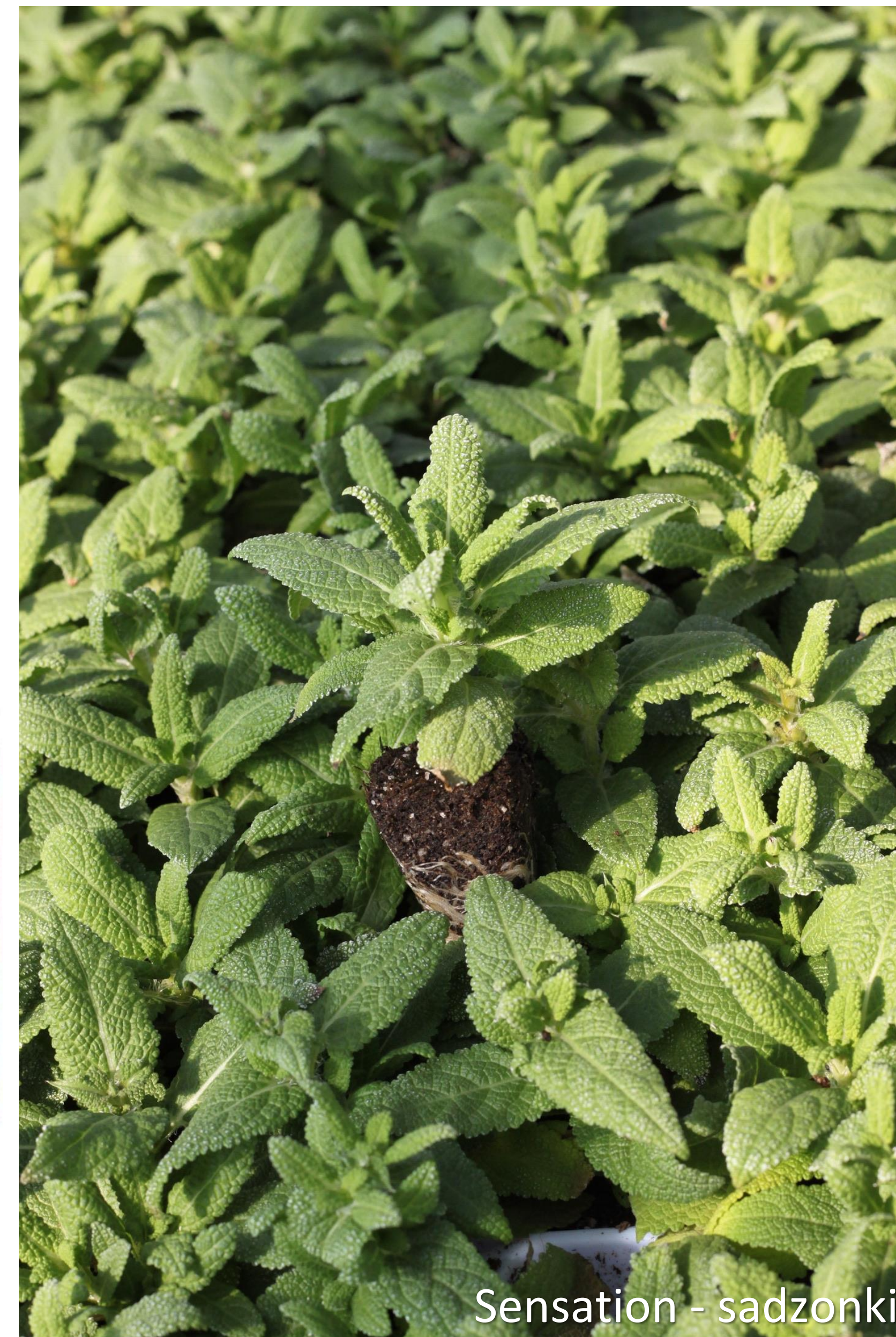
Sensation - sadzonki