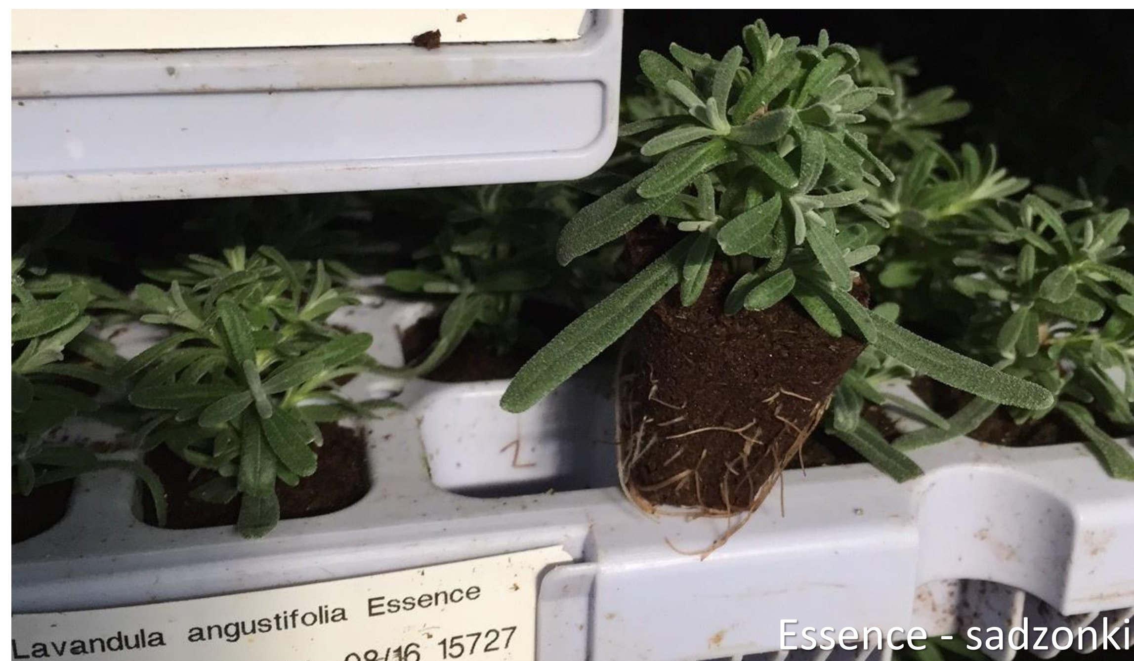
Essence - sadzonki