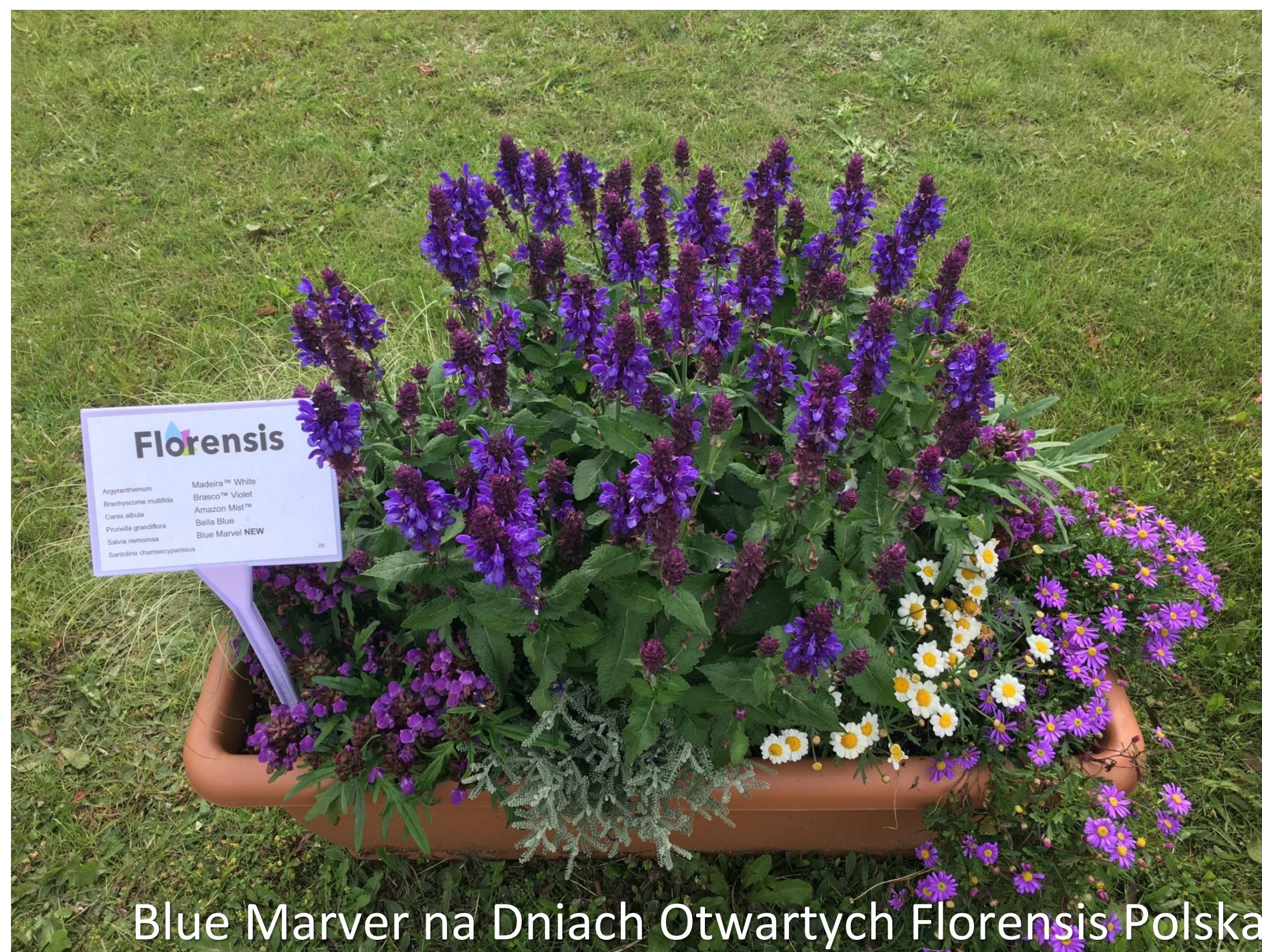
Blue Marver na Dniach Otwartych Florensis Polska