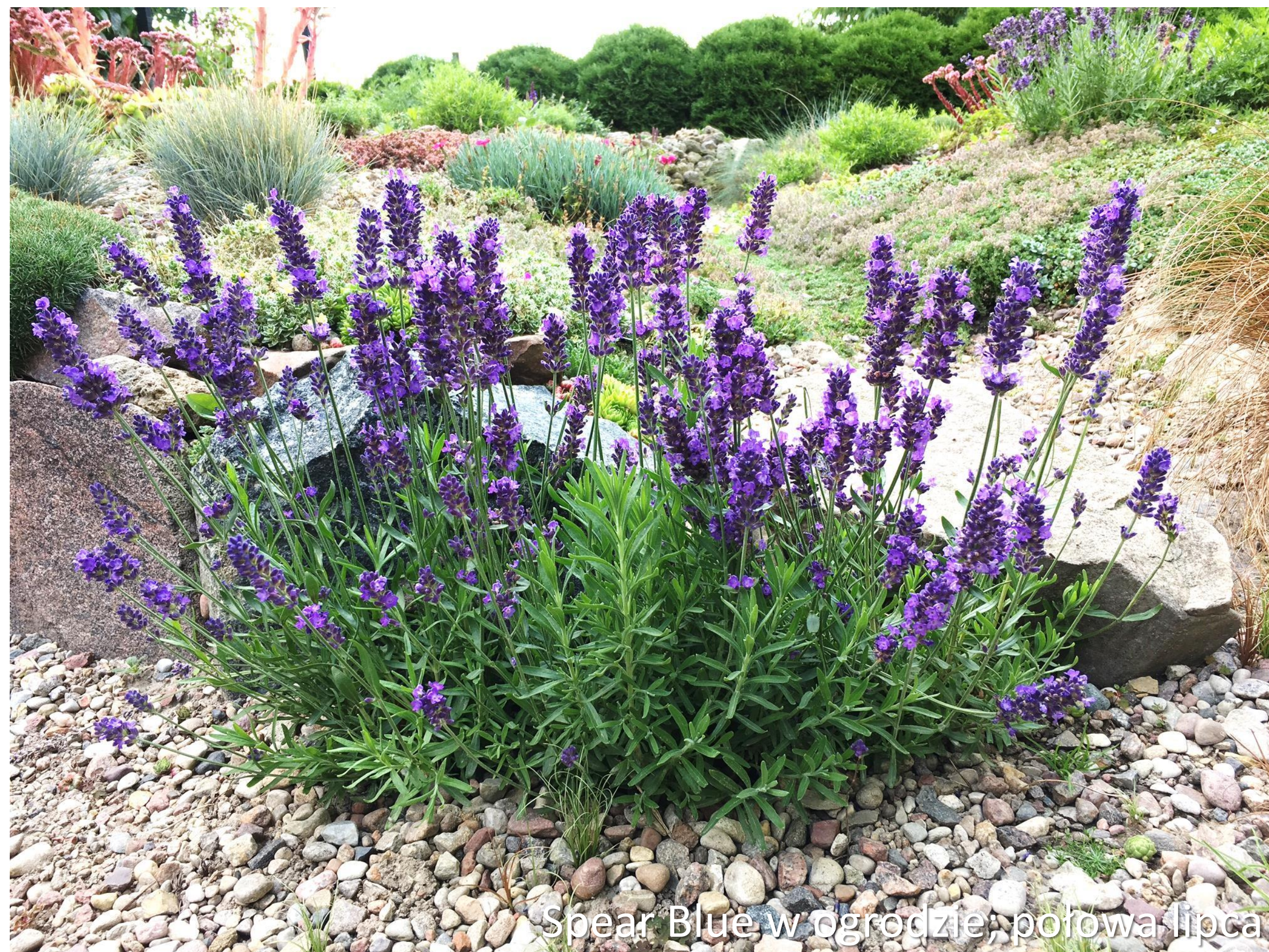
Spear Blue w ogrodzie; połowa lipca