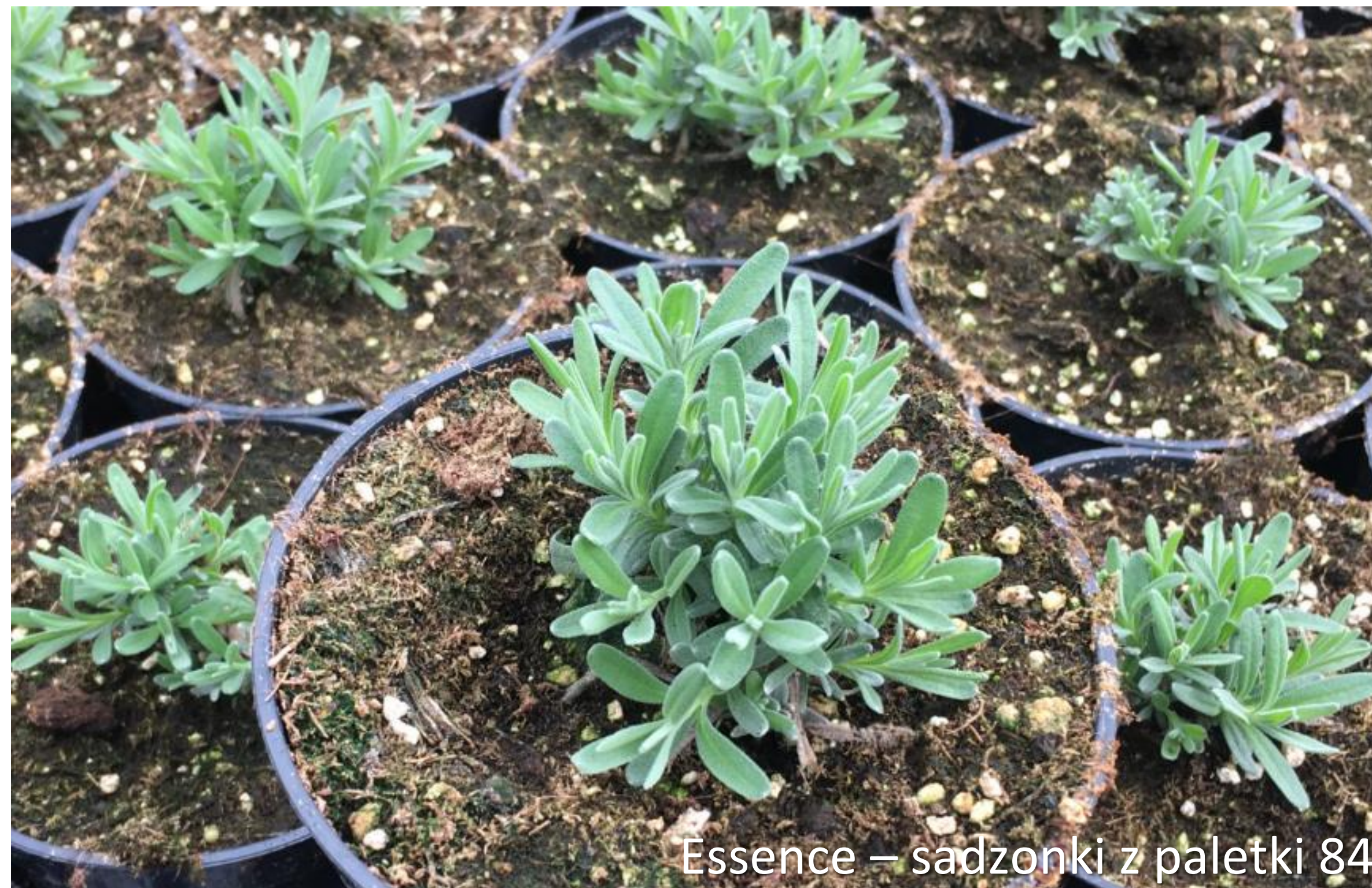
Essence – sadzonki z paletki 84