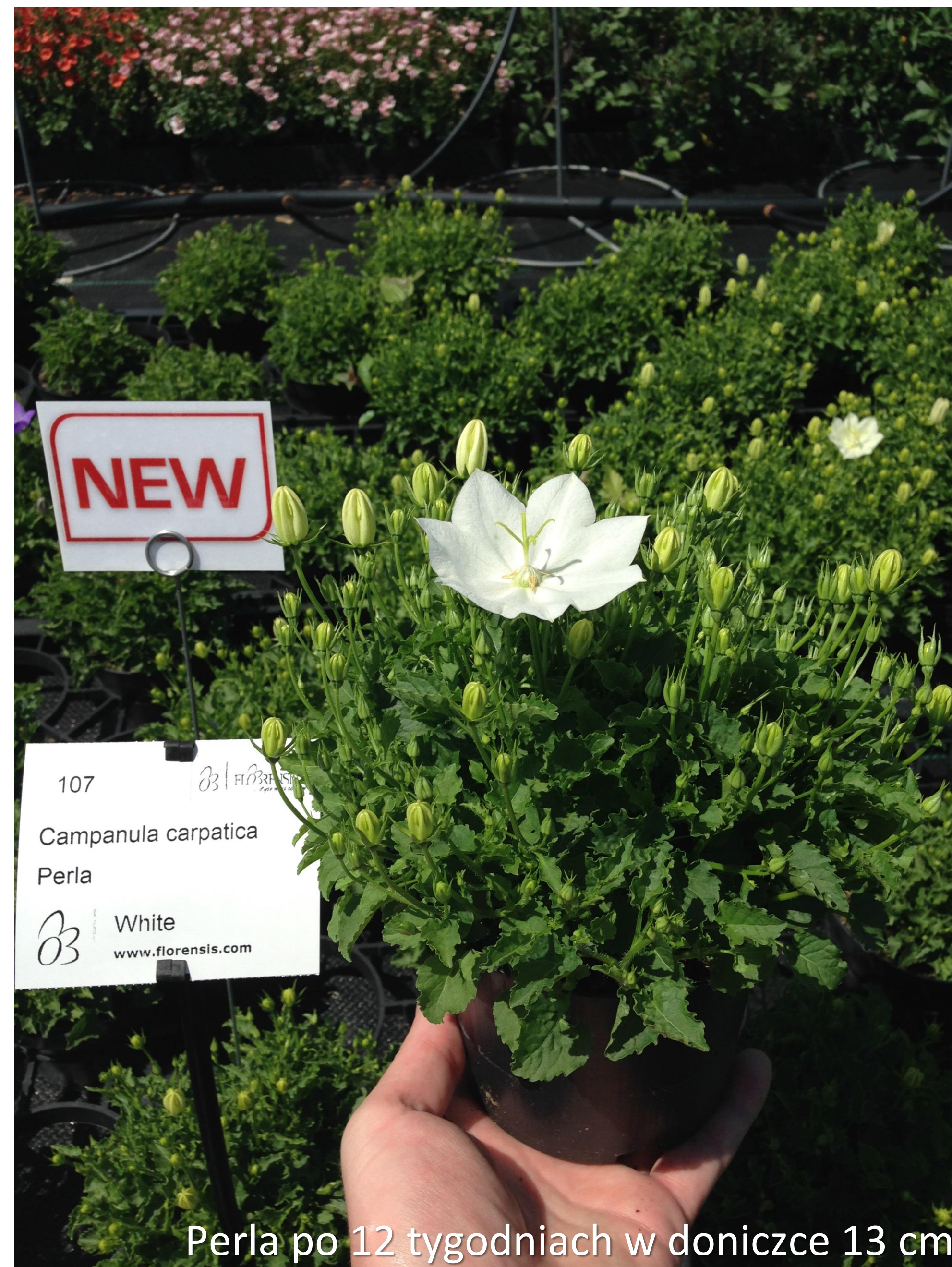
Perla po 12 tygodniach w doniczce 13 cm