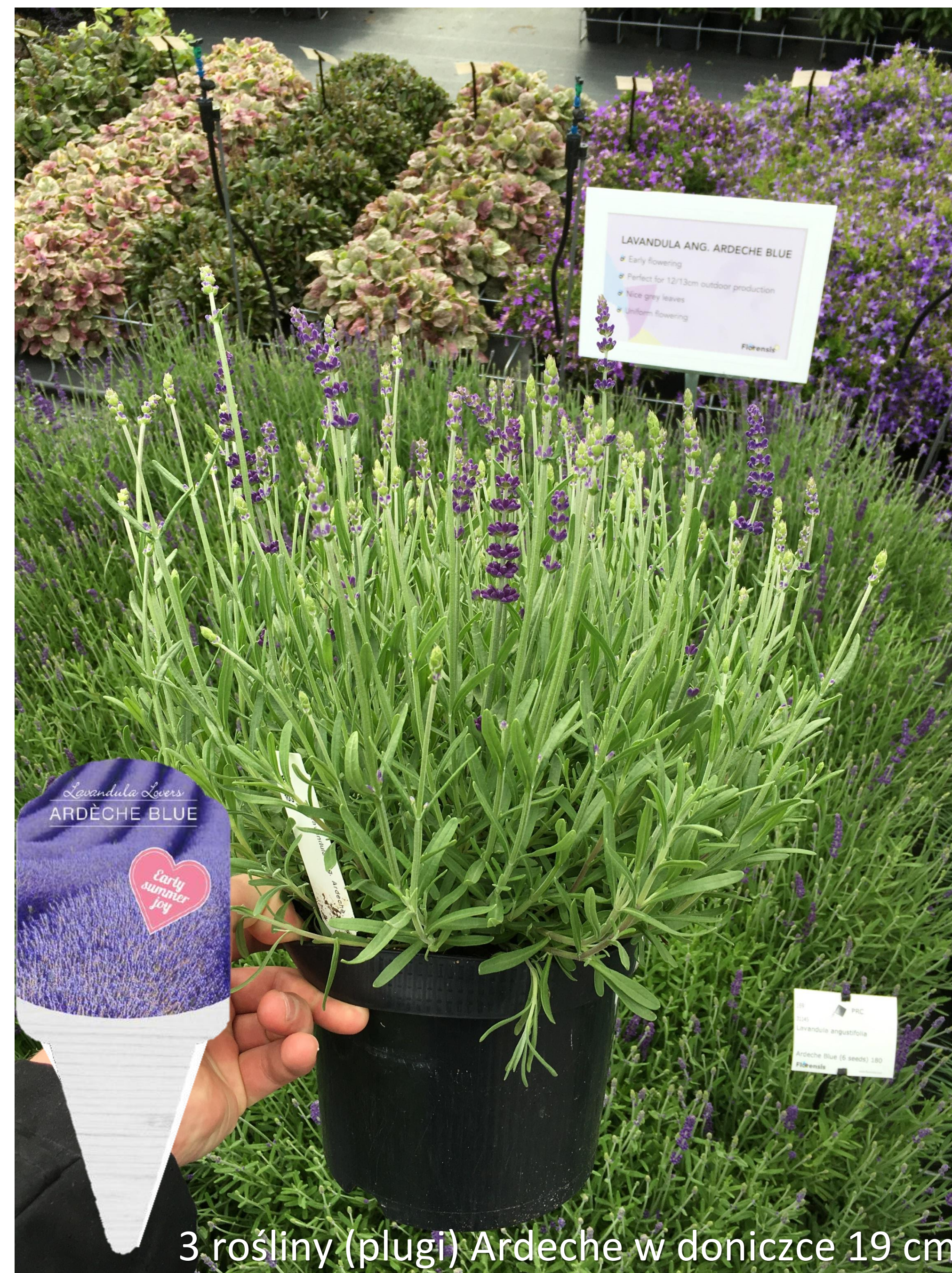
3 rośliny (plugi) Ardeche w doniczce 19 cm