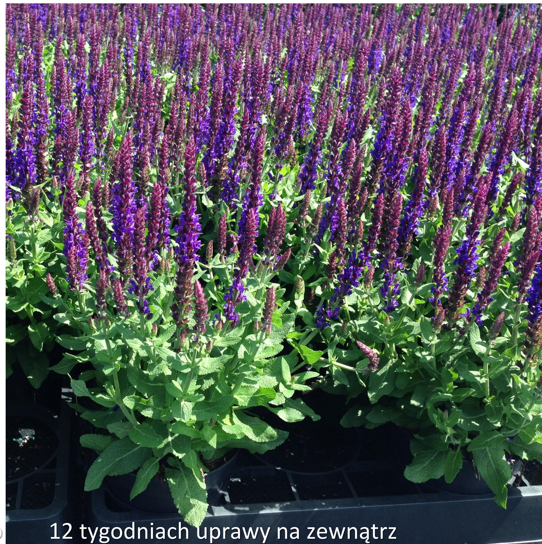
12 tygodniach uprawy na zewnątrz