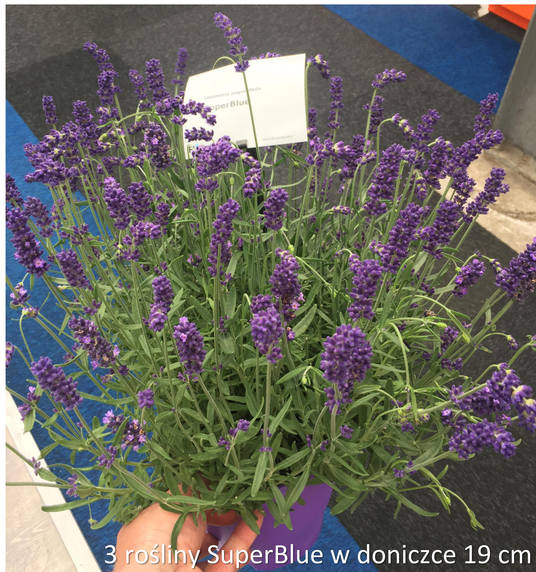
3 rośliny SuperBlue w doniczce 19 cm